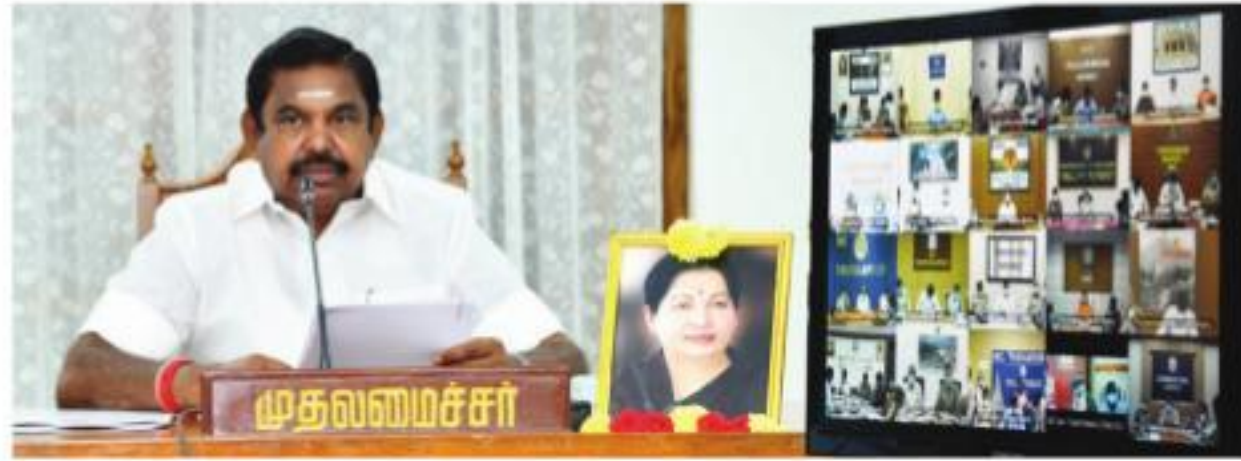
தமிழ்நாட்டில் கரோனா வைரஸ் பரவாமல் தடுக்க பல்வேறு துறைகளின் மூலம் மேற்கொள்ளப்பட்டு வரும் தொடர் பாய்ச்சலுக்கும் கட்டுப்படுத்தும் நடவடிக்கைகளை குறித்து அனைத்து மாவட்ட ஆட்சித் தலைவர்களுடன் காணொலிக் காட்சி மூலமாக தலைமைச் செயலகத்தில் வெள்ளிக்கிழமை ஆய்வு செய்த முதல்வர் எடப்பாடி கெ.பழனிசாமி.

கட்டுப்படுத்த ரூ.7,605 கோடி கரோனா நோய்த்தொற்றைக் கட்டுப்படுத்த சிசிசை மற்றும் நிர்வாகப் பணிகளுக்காக தமிழக அரசு இதுவரை ரூ.7,605 கோடி செலவு செய்துள்ளது. தமிழகத்தில் இதுவரை 1.58 கோடி பேருக்கு ஆர்டி-பிசிஆர் பரிசோதனை மேற்கொள்ளப்பட்டுள்ளது. நாளைக்குறித்து ஏறத்தாழ 70,000 பேர் இந்தப் பரிசோதனைக்கு உட்படுத்தப்பட்டு உள்ளார். தமிழகம் முழுவதும் 2,000 அம்மா சிறு