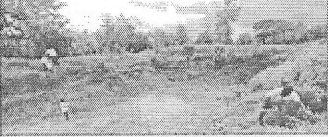
ପୋଖରୀରେ ପଶି ତଦନ୍ତକଲା ଲୋକାୟୁକ୍ତ ବିମ୍ବୁ

ପୂର୍ବଦିଗରେ ପୋଖରୀରେ ପଶି ତଦନ୍ତକଲା ଲୋକାୟୁକ୍ତ ବିମ୍ବୁ