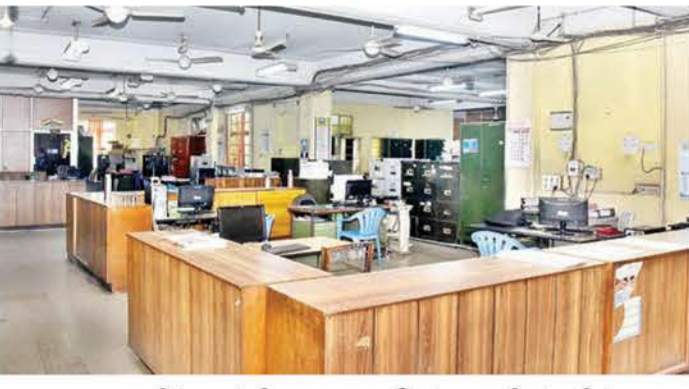
மதுரையில் புதன்கிழமை நடைபெற்ற ஊழியர்களின் வேலை நிறுத்தப் போராட்டத்தால் வெறிச்சோடி காணப்பட்ட யுனையெட் இந்தியா காப்பீட்டு நிறுவனம்.

மதுரை, ஆ.க. 4: அரசு பொதுக் காப்பீட்டு நிறுவனங்கள் தனியார் மய சட்டத்திற்குத் திறவேற்றப்பட்டதற்கு எதிர்ப்புத் தெரிவித்து மதுரையில் நடைபெற்ற வேலை நிறுத்தத்தில் 2 ஆயிரத்துக்கும் மேற்பட்ட ஊழியர்கள் பங்கேற்றனர். மக்களவையில் அரசு பொதுக் காப்பீட்டு நிறுவனங்கள் தனியார் மய சட்டத்திற்குத் திங்கள் கிழமை குரல் வாக்கெடுப்பு மூலம் நிறைவேற்றப்பட்டது. இதற்கு எதிர்ப்புத் தெரிவிக்கும் வகையில் நாடு முழுவதும் காப்பீட்டு நிறுவன ஊழியர்கள் ஆர்ப்பாட்டம், வேலை நிறுத்தம் உள்ளிட்ட போராட்டங்களை நடத்தி வருகின்றனர். இந்நிலையில் மத்திய அரசுக்கு எதிர்ப்புத் தெரிவித்து நாடு முழுவதும் உள்ள பொதுக்காப்பீட்டு நிறுவனங்கள் வேலை நிறுத்தப் போராட்டத்தை புதன்கிழமை