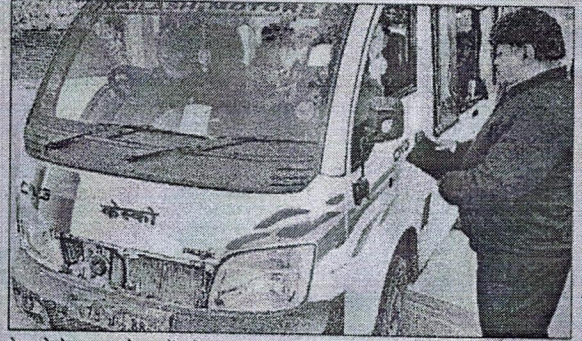
केसको के वाहन से बच्चों को पहुंचाया जा रहा था स्कूल, किया गया चालान।