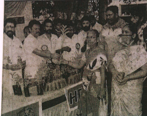
இந்த நாளை முன்னிட்டு கோவை காந்தியூர்ம் பஸ் நிலையத்தில் இலவசமாக வழங்கப்பட்டது.

சென்னை, ஜூன் 12- துவ மக்கள் கட்சியின் நிறுவனத்திடுத்துள்ள அறிக்கையில் கூறிய மற்றும் அரசு உதவிபெறும் கலை லுாரிகள், பாலிடெக்னிக் கல்லூரி லுாரிகள் மற்றும் கல்வி உதவித் யநிதிக் கல்லூரிகளில் பயிலும் களுக்கு பயனளிக்கக்கூடிய வகை ததல் ஏப்ரல் 2021 வரை நான்கு ன்றுக்கு 2 ஜிபி டேட்டா வுடன் டேட்டா கார்டுகள் வழங்கிட தமி ிட்டிருப்பதை பாராட்டி வரவேற் ல் முன்னிலை வகிக்கும் தமிழகத் டக்கத்தால் மாணவர்களின் கல்வி ற நல்லெண்ண அடிப்படையில் 5 அரசின் இந்த முடிவை பாராட்டு வர் கூறியுள்ளார்.