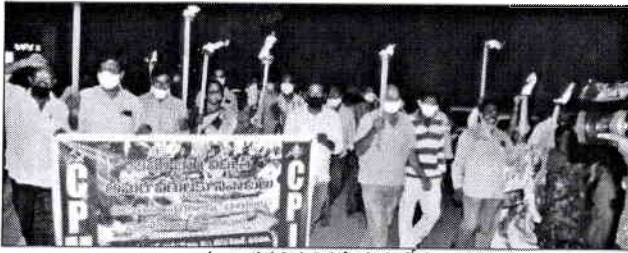
కాగడాల ప్రదర్శన నిర్వహిస్తున్న సేతలు

సిపిఎం, సిపిఐ ఆధ్వర్యంలో కాగడాల ప్రదర్శన