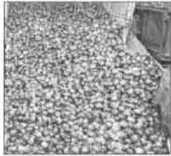
व किरकोळ बाजारत 'बनर स्टॉक' मधून कांदा विकला जात आहे. ऑगस्टच्या मध्यापासून २२ राज्यांत विक्रीला लागले आहे. एनसीसीएफ व एनएफईडीच्या दुकानातून २५ रुपये कितीचे कांदा विकला जात आहे.

नवी दिल्ली : देशात कांदाच्या दराने मोठ्या प्रमाणात वाढ होऊ लागल्यानंतर त्याचे चढते आता सरकारला बसू लागले आहेत. कांदाचा देशातील सरासरी दर ४७ रुपये किती झाल्याने सर्वसामान्य नागरिकांमध्ये संताप वाढू लागला आहे. त्यामुळे मतदारसंघाचे थेट कमी करण्यासाठी केंद्राने २५ रुपये कितीचे रेषा कमी करण्याचा निर्णय घेतला आहे. सरकारच्या 'बनर स्टॉक' मधून कांदाची ही विक्री केली जाणार आहे.