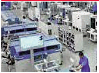
आणि अंपल ड्रायव्हिंग इंडेक्स वधारून ६.७ टक्के झाला आहे.

विशेष म्हणजे विजेचा वापर वाढल्याने विजेची मागणी गेल्या रविवारी संपलेल्या आठवड्यात मागील आठवड्यांच्या आधार घेता ५.३ टक्के वाढली आहे. तर मनुष्यांच्या सहभागाचा दर ४१.५ टक्के झाला असून मागील आठवड्यात तो ३९.८ टक्के होता, असेही या अहवालात म्हटले आहे.