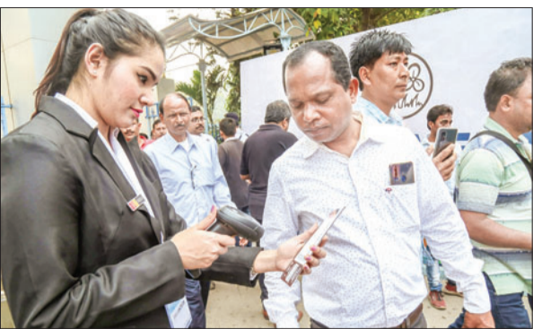
তৃণমূলের বৈঠকে ঢোকার আগে দলীয় কর্মীদের পরিচয়পত্র পরীক্ষা। নেতাজি ইন্ডোর সোমবার।

স্টাফ রিপোর্টার: 'গোলি মারো' যারা বলেছেন, তারা অনায়াস করছেন। তাদের কোনও ছাড় নেই। আইনের রাস্তায় থেকেই তাদের বিরুদ্ধে কড়া ব্যবস্থা নেওয়ার কথা জানিয়ে দিলেন মুখ্যমন্ত্রী মমতা বন্দ্যোপাধ্যায়। তাঁর কথায়, 'গোলি মারো যারা বলেছেন, তাদের ভাষাটা অন্যায়। প্ররোচনামূলক। ভাষাটা দানবিক। ভাষাটা বেআইনি। যারা বলেছেন, তাদের প্রত্যেকের বিরুদ্ধে আইন ব্যবস্থা নেওয়া হবে। ছেড়ে কথা বলা যাবে না।' তবে কাউকে আইন হাতে নিতে নিষেধ করেছেন মমতা। বলেছেন, কোনও উসকানিমূলক ঘটনা দেখলে প্রশাসনকে জানান। এর পরই মমতার স্পষ্ট হুঁশিয়ারি, "এটা দিল্লি নয় ভাই। এটা কলকাতা। এটা বাংলা। বুক পেতে রক্ত দেবে বাংলা। কিন্তু বলছে গোলি মেরে গন্দারোওকো উড়া দো। কে গন্দার সেটা তো আগে জানতে হবে। কারা গন্দার, সে তো মানুষ ঠিক করবে। আপনারা ঠিক করার কে?"