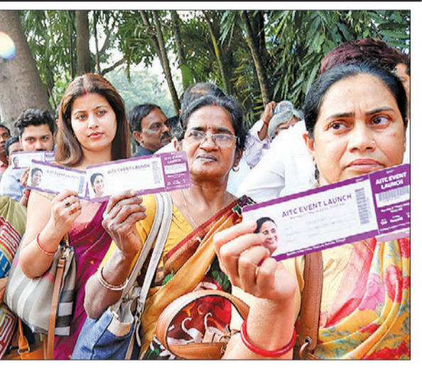
সারিবদ্ধ নেতাজি ইন্ডোর তৃণমূলের বৈঠকে ঢোকার আগে দলীয় কর্মীদের লাইন।

মারো সালোকো'। দিল্লিতে বিজেপির নেতা-কর্মীদের দেওয়া এই স্লোগান সিএএ-বিরোধী আন্দোলনে যি চলে। অভিযোগ, তাতে বহিরাগতদের এনে প্ররোচনা দেওয়ার। আশঙ্ক জলে যায় দিল্লিতে। মৃত্যুর সংখ্যা প্রায় পঞ্চাশ। কলকাতায় কেন্দ্রীয় স্বরাষ্ট্রমন্ত্রীর সভার সময়ও সেই স্লোগানকে হাতিয়ার করে নেমে পড়েন বিজেপির ক'জন কর্মী-সমর্থক। সঙ্গে সঙ্গে তৎপর হয় প্রশাসন। খবর নেন মুখ্যমন্ত্রী। ব্যবস্থা নেওয়া হয় আইনি পথে। বুঝিয়ে দেওয়া হয় এসব এখানে বরণীয় করা হবে না। বলেছেন, "যে এসব কথা বলে উসকেছে, এতগুলো মানুষ খুন হওয়ার পরও কেন সে হেফত তার হয়নি? আর কলকাতার রাস্তায় যারা স্লোগান দিয়েছিল, তাদেরও জনকে হেফতার করিয়েছি।"