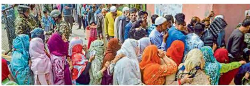
श्रीनगर : येथील मतदान केंद्रावर सोमवारी मतदानासाठी लागलेल्या रांगा.