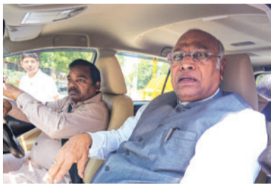
मल्लिकार्जुन खरगे, कांग्रेस अध्यक्ष

कांग्रेस नर्सिंग घोटाले को भी चुनावी मुद्दा बनाएगी। मध्य प्रदेश उच्च न्यायालय के ग्वालियर खंडपीठ के समक्ष एक याचिका दायर करके नर्सिंग कॉलेजों से जुड़ी धोखाधड़ी की बात कही गई थी।