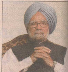
Former Prime Minister Manmohan Singh

Targeting the government, Singh said the country's youth, farmers and farm workers, entrepreneurs and the marginalised sections deserve better. India cannot afford to continue down this path, he said, adding, "I urge the government to put aside vendetta