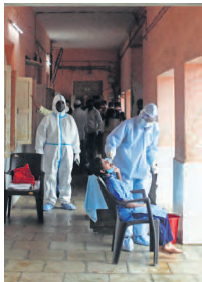
A health worker collects a swab sample at a children's home in Mumbai.

Over the past two weeks, Delhi has also seen a decline in new cases. From being the state with the second-highest number of active cases, Delhi is now down to the 10th position. On 23 June, Delhi saw its highest single-day tally of more than 4,000 cases, putting the health infrastructure under pressure. Since then, the Delhi government, along with the Union government, has ramped up efforts to increase testing from 5,000 per day to approximately 20,000 a day along with increasing the number of containment zones.