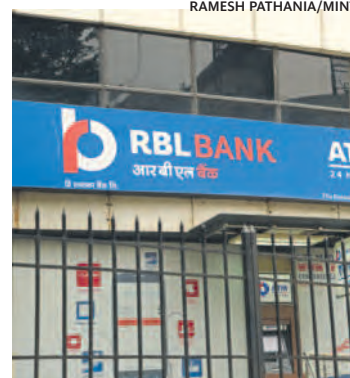
The bank's total provisions more than doubled on a y-o-y basis to ₹500 crore in Q1 FY21.

Like other lenders, RBL Bank's loans under moratorium has declined as well. It said that 13.7% of