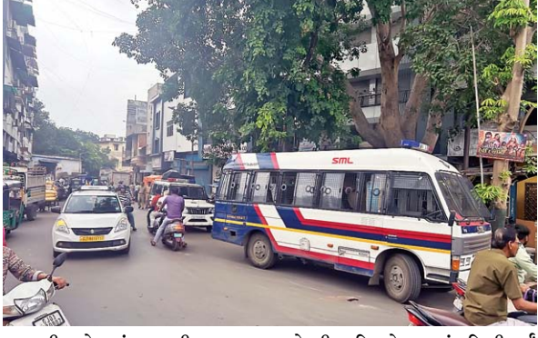
યુવકની જાહેરમાં હત્યાની ઘટનાના પગલે બીજા દિવસે પણ તંગદિલીભર્યું વાતાવરણ રહેતાં તંકદારીના ભાગરૂપે પોલીસ બંદોબસ્ત ગોઠવાયો હતો.