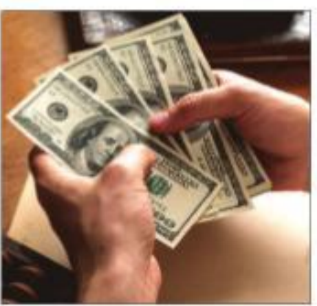
This was the third consecutive week of a widening in the forex kitty

INDIA'S FOREX RESERVES increased by $2.9 billion to $550.142 billion as on November 25, making it the third consecutive week of a widening in the kitty, the Reserve Bank said on Friday. In the previous week ended November 18, the overall reserves had risen by $2.54 billion to $547.252 billion.