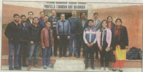
कुरुक्षेत्र। प्लेसमेंट शिविर में चयनित हुए विद्यार्थी।