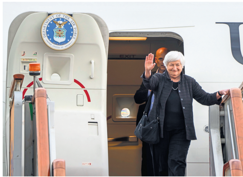
US treasury secretary Janet Yellen waves as she arrives in Beijing on Thursday.

Yellen's visit was among the topics most frequently asked about by local Chinese clients speaking to Goldman Sachs Group Inc. economists in recent days, according to a note published by the investment bank Wednesday. Clients were also looking for