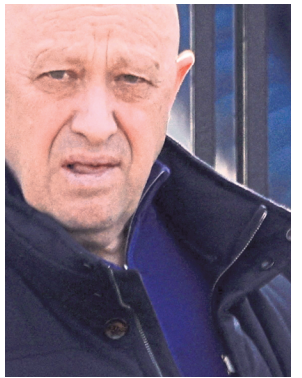
Wagner chief Yevgeny Prigozhin.

But much about the agreement, which was brokered by Lukashenko, remains murky.