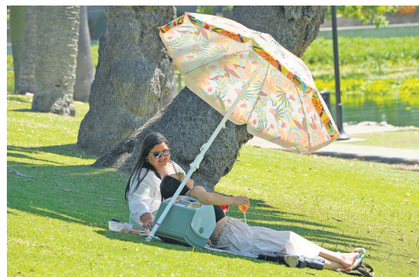
Globally, June was just over 0.5C above the average temperature for the same month in 1991-2020.

Above-average temperatures swept through countries