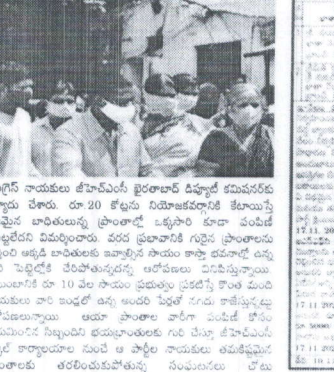
కొంగర సాయం కేంద్రం వారు పంపిణీ చేస్తున్న సాయం. బాధితులకు సాయం చేయడం ప్రధాన లక్ష్యం.

అధికార సార్వత్రిక చట్టం... అధికారులు... ● బాధితుల గుర్తింపు చేయడం... ● నాయకులు చెప్పిన వారితో సాయం... ● పంపిణీలోనూ గౌరవం... ● అడుగు చేయలేని పోలీసులు... ● మధ్యలోనే ఆపేస్తున్న నిబంధన