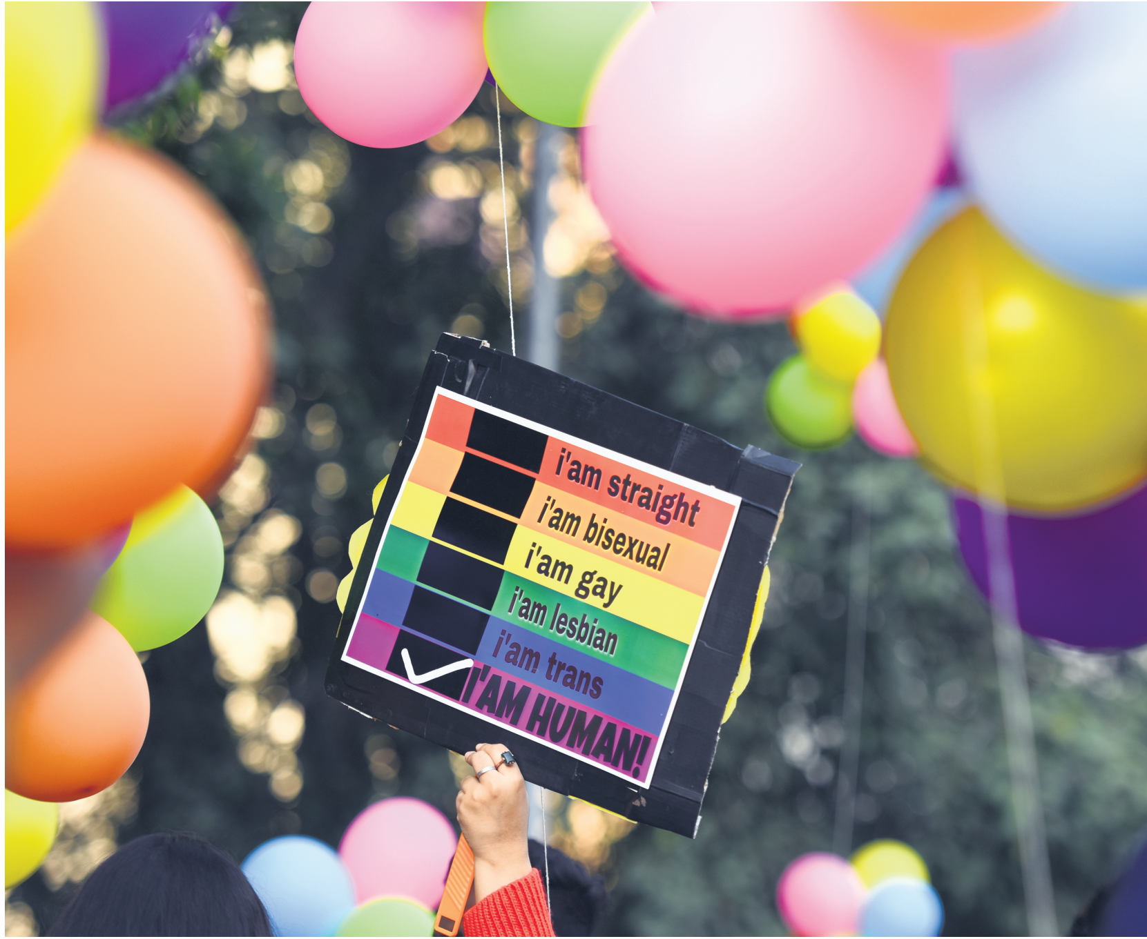
Members and supporters of the LGBTQ+ community take part in Delhi's Queer Pride Parade on 25 November 2018.