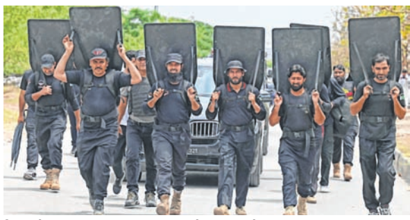
Security personnel escort a vehicle carrying Imran Khan as he leaves an anti-terrorism court in Islamabad on Tuesday

olence especially against state institutions and symbols like the General Headquarters, Supreme Court and Parliament," she said.