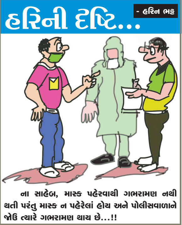
ના સાહેબ, મારક પહેરવાથી ગભરામણ નથી થતી પરંતુ મારક ન પહેરેલાં હોય અને પોલીસવાળાને બોલે ત્યારે ગભરામણ થાય છે...!!

એકસાથે મંજૂરી આપી છે તેમાં ઝોડાની બે ડ્રાફ્ટ ટીપી સ્કીમ નં. ૪૩૦ વિસલપુર નં. ૪૩૬ ભાવનગરની ડ્રાફ્ટ ટીપી સ્કીમ નં. ૧૬, અમદાવાદની જ બે વેરીડ પ્રીલીમીનરી ટીપી સ્કીમ નં. ૧, ૪૭ તથા બે ફાઇનલ ટીપી સ્કીમ જેમાં ઝોડાની નં. ૧/૧ અને અડાલજ તથા રાજકોટની ટીપી ટને મંજૂરી આપી છે.