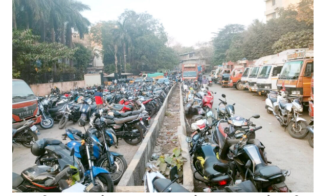
तांत्रिक बाबी पूर्ण झाल्यानंतर या कामासाठी निविदा प्रक्रिया सुरू करण्यात आली आहे. चांदिवलीतील प्रस्तावित डीपी रस्ता होणार्या जागेवरील सुमारे ८० ते ९० बांधकामे बाधित होणार आहेत. या रस्त्याच्या बाजूच्या खासगी आणि रस्ता होणाऱ्या जागेवरील बाधित बांधकामे हटविण्यासाठी