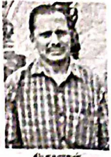
மில் அதிபர் தற்கொலை

தோய்செட்டி பானையம் அருகே கீழ்பவானி வாய்க்காலில் குதித்து மில் அதிபர் தற்கொலை தோய்செட்டி பானையம் அருகே கீழ்பவானி வாய்க்காலில் குதித்து மில் அதிபர் தற்கொலை