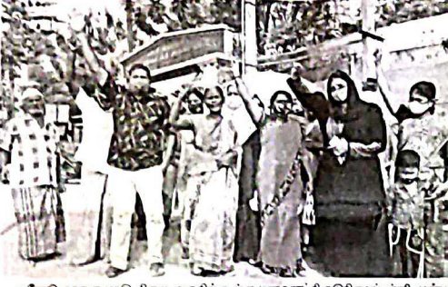
சேலம் அகலிமங்கலம் கிராமம், சேலம் அகலிமங்கலம் கிராமம்

நவீன கிராமியர் பயிற்சியை மேம்படுத்தும் நவீன கிராமியர் பயிற்சியை மேம்படுத்தும்