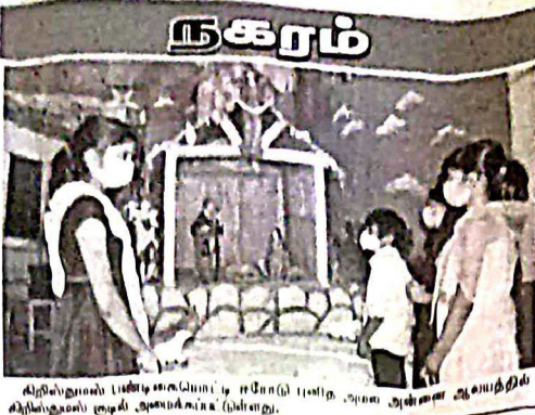
திருவள்ளூர் மாவட்டம், சேலம் அகலிமங்கலம் கிராமம், சேலம் அகலிமங்கலம் கிராமம்

யினாஸ்திக பயன்பாட்டை தவிர்க்க உற்பத்தியை தடுப்பது அவசியம் யினாஸ்திக பயன்பாட்டை தவிர்க்க உற்பத்தியை தடுப்பது அவசியம்