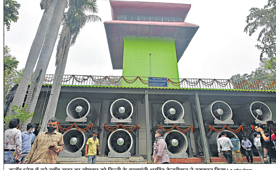
कर्नाट प्लेस में बने स्मॉग टावर का सोमवार को दिल्ली के मुख्यमंत्री अरविंद केजरीवाल ने उद्घाटन किया।

प्रदूषण से निपटने के लिए आज तक देश में ऐसा स्मॉग टावर नहीं लगाया गया। अमेरिकी तकनीक से बनाया गया यह टावर एक किलोमीटर के दायरे में हवा को साफ करेगा।