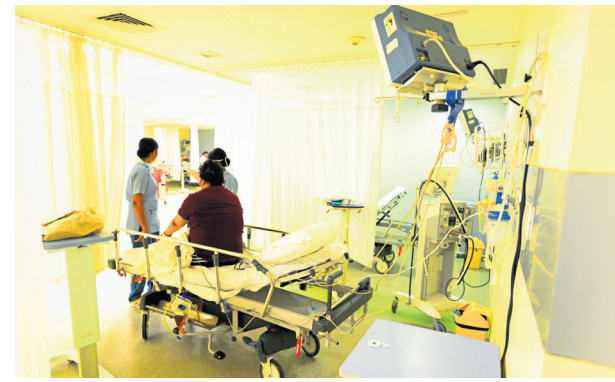
Asia Healthcare Holdings will use the capital raised to acquire new single-specialty healthcare businesses as in the past.

"The capital raised will be used to acquire new single-specialty healthcare busi-