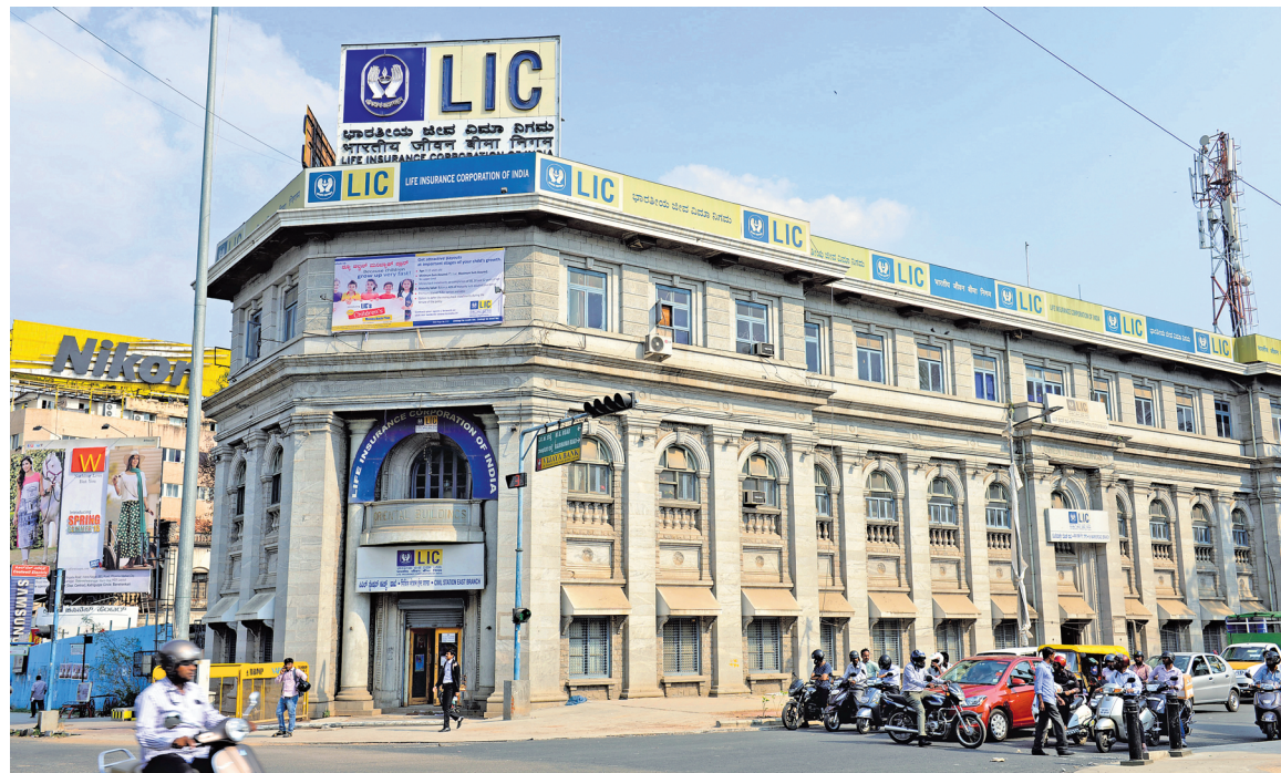
LIC, India's largest insurer, is expected to be listed on the stock exchanges in the March quarter of this fiscal year.

On 15 July, Dipam had said it will appoint up to 10 investment bankers with requisite experience in public offering, who together will form a team