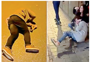
ஆம்ஸ்டர்டாமில் தாக்குதலுக்கு ஆளான இஸ்ரேல் பிரஜைகள்.

அவர்கள் தாக்கப்பட்டனர். அவர்களில் சிலர் பாலஸ்தீன கொடிகளை ஏற்றிக்கொண்டு கூச்சலிட்டனர். இந்த தாக்குதலில் படுகாயமடைந்த இஸ்ரேல் பிரஜைகள் குறித்த முழு விபரங்கள் வெளியாகவில்லை என்றாலும், அதனை இஸ்ரேல் ஊடகங்கள் உறுதி செய்துள்ளன. மூன்று பேர் காயமடைந்தனர். நபர்கள் அனைவரும் கால்பந்து சேர்ந்தபலர் கைது செய்யப்பட்டதாக போலீசார்