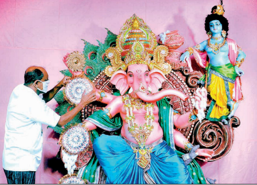
ভবানীপুর গণপতি ভক্তমণ্ডলীর গণেশপূজা।

করোনা আক্রান্ত হয়ে মৃত পুরকর্মীর পরিবারের একজনকে নিয়োগের প্রক্রিয়া শুরু করল কলকাতা পুরসভা। কোভিডে মৃত কর্মীর তালিকা তৈরি করে দ্রুত জমা দেওয়ার নির্দেশ দিয়ে সম্প্রতি বিজ্ঞপ্তি জারি করেছে পুর কর্তৃপক্ষ। পুরসভার এই নির্দেশিকা পাঠানো হয়েছে। বিজ্ঞপ্তি অনুযায়ী পুরসভার বিভিন্ন দপ্তরে মৃতদের তালিকা তৈরি করতে হবে। সবে পরিবারের একজনকে চাকরি দেওয়া হবে। যাঁরা করোনা যুক্ত হয়ে মৃত হলে সেসব কর্মীর পরিবারের একজনকে চাকরি দেওয়া হবে। সেইমতো কলকাতা পুরসভা কাজ শুরু করল। প্রতিটি দপ্তরে পুরসভা কর্তৃক আক্রান্ত কর্মীর বিস্তারিত তথ্য দিয়ে তালিকা জমা দিতে বলা হয়েছে।