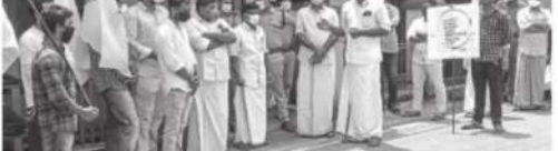
പനങ്ങൾ സഹ. ബാങ്കിലെ അഴിമതി ഡിവൈഎഫ്ഐ പ്രതിഷേധമാർച്ച് നടത്തി.