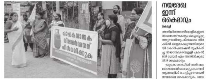
പാലകവാതിക വില്പനയ്ക്കായി സന്നദ്ധതയോടെ പങ്കെടുത്തു.