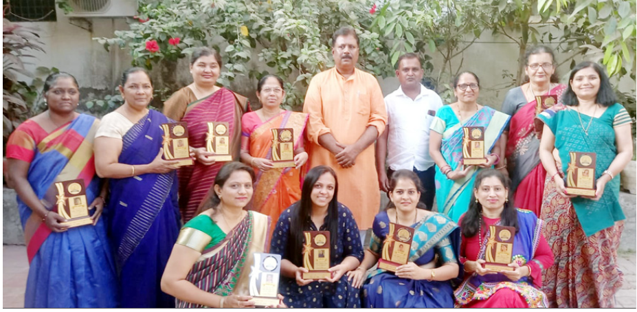
પાલ ગામ સ્થિત પ્રાથમિક શિક્ષણ સમિતિ સંચાલિત શાળામાં મહિલા દિવસની ઉજવણી કરાઈ હતી.