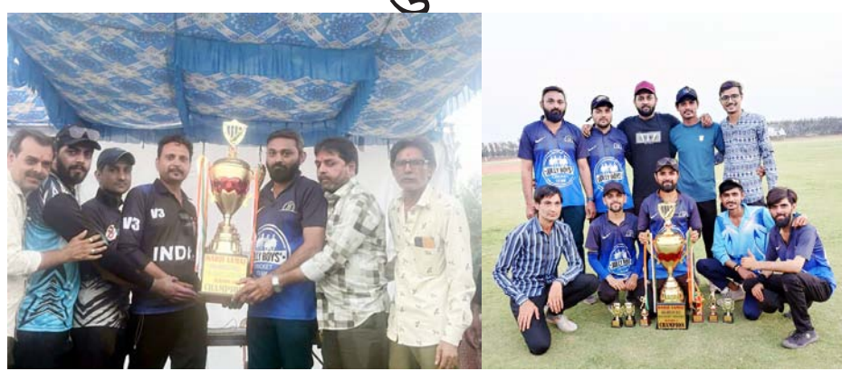
ધબકાર પ્રતિનિધિ, સુરત, તા. ૦૮ તેમની ટીમના મેમ્બરો દ્વારા કરવામાં પેલાડીઓ પેલેટિલીની ભાવનાથી રમી આવ્યું હતું. આ ટુર્નામેન્ટમાં બધા જ રાષ્ટ્રગાન ગાયને છૂટા પડ્યા હતા.