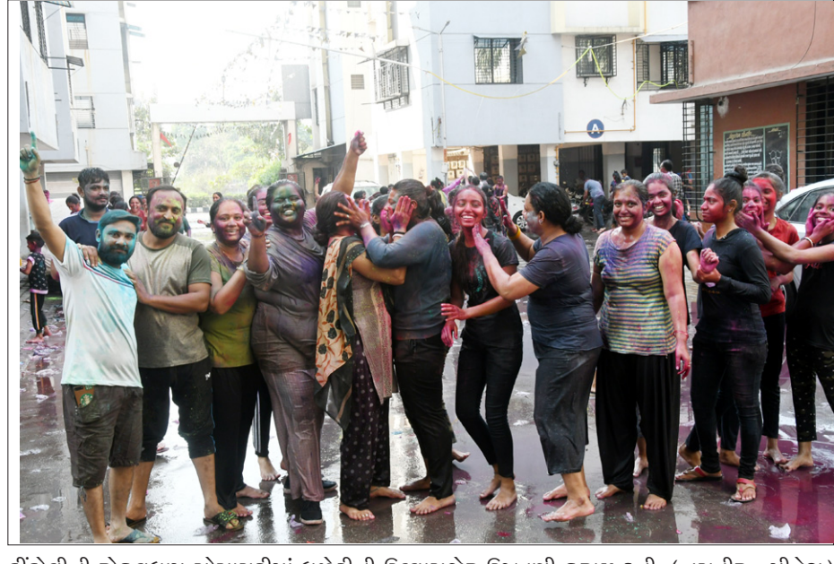
ડોંડોલીની રોકુલધામ સોસાયટીમાં ઘુળેટીની ઉલ્લાસભર ઉજવણી કરાઈ હતી.