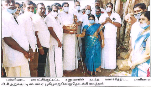
பண்படை ஊராட்சிக்குட்பட்ட கலாநாயகி தங்க வசந்திக்குட்பட்ட பண்படை வி.சி.ஆர்.முத்துசாமி என்.டி.முத்துசாமி கலை நிகழ்ச்சி.