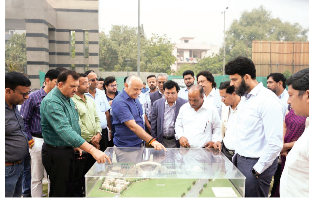
கிழக்கு தில்லி ஜூனாமல் பகுதியில் 18.75 ஏக்கர் பரப்பளவில் புதிதாக கட்டப்பட்டு வரும் குருகோவிந்த் சிங் இந்திர பிரஸ்தா பல்கலைக்கழகத்தின் இறுதிப் பணிகளை புதன்கிழமை ஆய்வு செய்த துணை முதல்வர் மனீஷ் சிசோடியா.