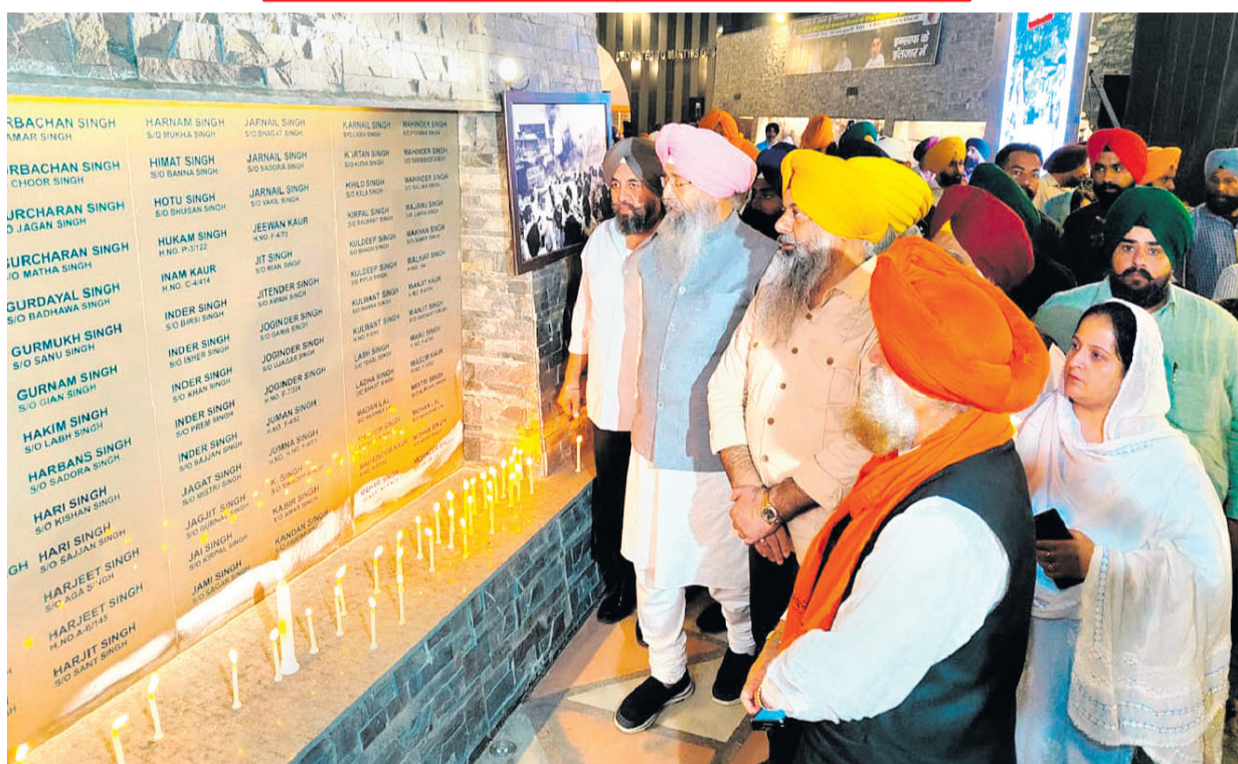
1984-ஆம் ஆண்டு வன்முறையில் பலியான சீக்கியர்களுக்கு, தில்லி ரஹாப் கஞ்ச் குருத்தவாராவில் உள்ள நினைவுச் சுவரில் செவ்வாய்க்கிழமை மெழுகுவார்த்தி ஏற்றி அஞ்சலி செலுத்திய சீக்கியர்களின் குடும்பத்தினர்.