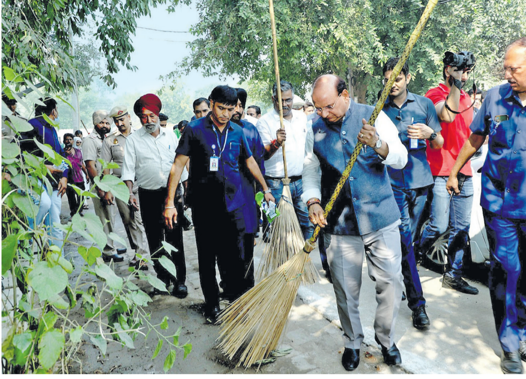
தில்லி மாயாபுரி தொழிற்பேட்டையில் செவ்வாய்க்கிழமை துப்புரவு பணியை தொடக்கி வைத்த துணை நிலை ஆளுநர் வி.கே. சச்சேனா.

அதன்படி, தில்லி மாயாபுரியில் 'ஆபரேஷன் கிளின் தில்லி' இயக்கத்தை அவர் தொடக்கிவைத்தார்.