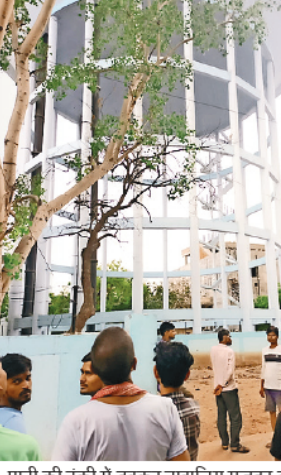
पानी की टंकी में डूबकर नाबालिग मजदूर की मृत्यु होने की घटना के बाद जुटे बस्ती के लोग ● जागरण

जागरण संवाददाता, आगरा: गद्दी भदौरिया में जल निगम की पानी की टंकी में गिरकर नाबालिग मजदूर की मृत्यु हो गई। नाबालिग को ठेकेदार काम करने को साथ लेकर गया था। मजदूर के पिता ने जल निगम की लापरवाही के चलते बेटे की मृत्यु होने का आरोप लगाया।