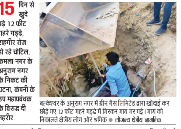
बल्केश्वर के अनुराग नगर में ग्रीन गैस लिमिटेड द्वारा खोदाई कर छोड़े गए 12 फीट गहरे गड्ढे में गिरकर गाय मर गई। गाय को निकालते क्षेत्रीय लोग और श्रमिक