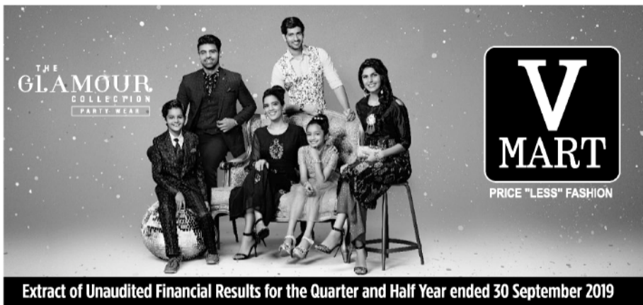
Extract of Unaudited Financial Results for the Quarter and Half Year ended 30 September 2019

संपत्ति की गुणवत्ता में गिरावट आने के कारण येस बैंक को सितंबर तिमाही में एकीकृत आधार पर 629.10 करोड़ रुपये का घाटा हुआ है। बैंक को पिछले वित्त वर्ष की समान तिमाही में 951.47 करोड़ रुपये का शुद्ध लाभ हुआ था। इस वित्त वर्ष की पहली तिमाही में भी बैंक को 95.56 करोड़ रुपये का शुद्ध लाभ हुआ था। बैंक ने कहा कि इस दौरान बैंक की कुल एकीकृत आय भी पिछले वित्त वर्ष के 8,713.67 करोड़ रुपये से कम होकर चालू वित्त वर्ष में 8,347.50 करोड़ रुपये पर आ गई। बैंक की परिसंपत्ति की गुणवत्ता में इस दौरान भारी गिरावट देखने को मिली है। उसकी समग्र गैर-निष्पादित परिसंपत्ति (एनपीए) 1.60 फीसदी से बढ़कर 7.39 फीसदी पर पहुंच गई। शुद्ध एनपीए भी 0.84 फीसदी से बढ़कर 4.35 फीसदी पर पहुंच गया। बैंक ने कहा कि एनपीए के लिए किया जाने वाला प्रावधान 942.53 करोड़ रुपये से बढ़कर 1,336.25 करोड़ रुपये पर पहुंच गया। भाषा