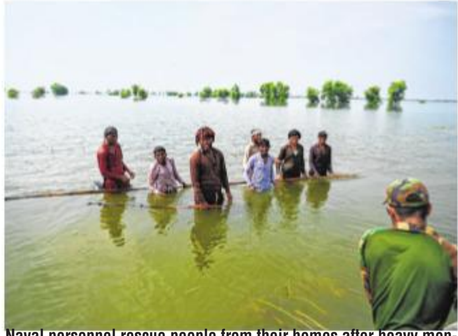
Naval personnel rescue people from their homes after heavy monsoon rains in Dadu, Sindh, on Wednesday

new challenge in the form of water-borne infectious diseases, Sharif said. "We will need trillions of rupees to cope with this