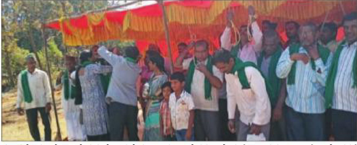
ಕೂಡಲೇ ಈ ಯೋಜನೆ ರದ್ದುಗೊಳಿಸಬೇಕು ಎಂದು ರೈತರ ನಿರತ ರೈತರು ಆಗ್ರಹಿಸಿದರು.

ಹಲಗಾ- ಮಚ್ಚೆ ಬೈಪಾಸ್ ರಸ್ತೆ ಕಾಮಗಾರಿಗೆ ತೀವ್ರ ವಿರೋಧ ವ್ಯಕ್ತಪಡಿಸಿರುವ ರೈತರ ಧರಣಿ ಸತ್ಯಾಗ್ರಹ ಎರಡನೇ ದಿನವಾದ ಬುಧವಾರವೂ ಮುಂದುವರಿದಿದೆ. ರೈತರ ತೀವ್ರ ವಿರೋಧದ ನಡುವೆಯೇ ಬೈಪಾಸ್ ರಸ್ತೆ ಕಾಮಗಾರಿ ಕೈಗೊಳ್ಳಲು ಮುಂದಾದರೆ ನಾವು ಆತ್ಮಹತ್ಯೆ ಮಾಡಿಕೊಳ್ಳುವುದು ಅನಿವಾರ್ಯವಾಗುತ್ತದೆ ಎಂದು ರೈತರು ರಾಷ್ಟ್ರೀಯ ಹೆದ್ದಾರಿ ಪ್ರಾದಿಕಾರ ಮತ್ತು ರಾಜ್ಯ ಸರ್ಕಾರಕ್ಕೆ ಎಚ್ಚರಿಕೆ ನೀಡಿದರು.