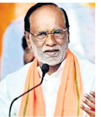
కోసం ఎంతకైనా తెగిస్తుందని అన్నారు. రాజ్యాంగ నిర్మాణంలో అంటే దిద్దుకో వచ్చింది. ప్రపంచంలో ఏ ప్రభుత్వం కూడా ఇలా చేయలేదని విప్లవాత్మకమైన మార్పును కామ్రాద్ గా చూడతూ వస్తున్నారని, నిరు ద్యోగుల కోసం తాము అప్పుడేమైనా పథకాన్ని తీసుకువ

మునరెండ్ర మోడి తిలంగాణకు వచ్చి హైదరాబాద్ సీటును ఓపైసీ లీజుకు ఇచ్చారని అసదుద్దీన్ ప్రధాని మోడిని కోరతాం. "మోడీ అధికారం మీకుంది. గంట సమయం క న్నా 15 నిమిషాలు అమెకివ్వండి. మేం కూడా మానవత్వం ఎంత మిగిలి ఉందో లేదో చూస్తాం. మేం భయపడం. మిమ్మల్ని ఎవరూపు తారు? ప్రధాని మీ వ్యక్తి, ఢిల్లీలో ఉంటారు. ఆర్ఎన్ఎస్ఎస్ మీది. ప్రతిదీ మీదే. చెప్పండి ఎక్కడకు రమ్మంటారు. అక్కడకు వస్తాం." అని ఓపైసీ సోదరులు గట్టి కౌంటర్ ఇచ్చారు.