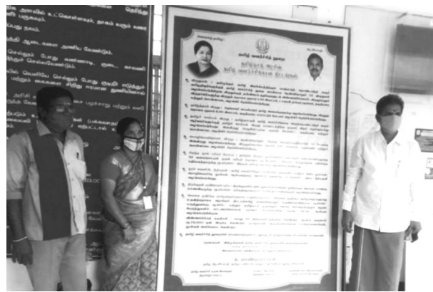
Director of Tamil Development Department Vijayaraghavan inaugurated a display poster, containing various plans of the department plans, including distribution of awards, financial assistance for writing Tamil books, also to aged authors of Tamil books at the District Collectorate complex.

The Amazing TVs (4K range) provides Amazing TV viewing experience with host of latest technology features to enhance consumer delight. It provides Amazing Picture with features like Quantum Dot and Full Array Dimming.