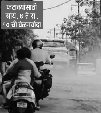
फटाक्यांसाठी सायं. ७ ते रा. १० ची वेळमर्यादा