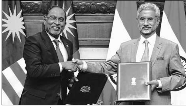
Foreign Minister S Jaishankar and his Malaysian counterpart Zamry Abdul Kadir at a Joint Commission Meeting in Delhi

PTI / NEW DELHI X ahead of the meeting. Last week, the MEA said the JCM will review the progress of enhanced strategic partnership in areas of politics, defence, security, economic, trade and investment, health, science and technology. The last JCM was held in Kuala Lumpur in 2011. The Malaysian foreign ministry on Sunday said both foreign ministers will also exchange views on regional and international matters of mutual interest. "The visit is expected to further strengthen bilateral relations of the two countries," it said. "Bound by robust economic partnership and close people-to-people ties, Malaysia and India share a long-standing and substantive relationship," it said.