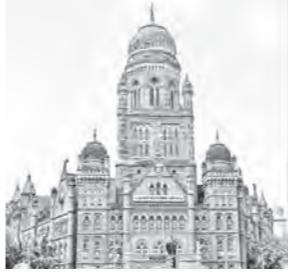
केल्या जाणाऱ्या कारवाईमध्ये प्रामुख्याने पाणी तोडणे, जप्ती इ. बाबींचा समावेश आहे.

मालमत्ता कराच्या रकमेचा भरणा संबंधितांद्वारे वेळेत केला जावा तसेच, थकबाकीदारांकडे बाकी असलेल्या रकमेचाही भरणा व्हावा, यासाठी महापालिकेच्या स्तरावर विविधस्तरिय कार्यवाही केली जात आहे. थकबाकीदारांवर