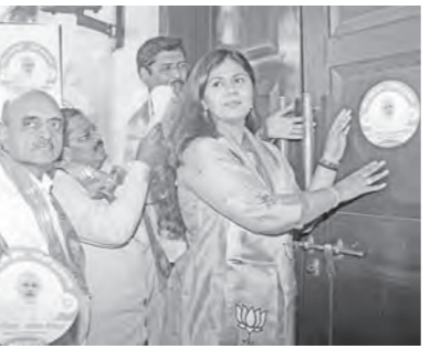
कामही सरकारने केले आहे. हे यशस्वी झालेले काम जनसामान्यांपर्यंत पोहोचाला हवे." राज्यातील २५ लाख कार्यकर्त्यांच्या माध्यमातून राज्यातील दोन कोटींहून अधिक घरांपर्यंत हा कार्यक्रम पोहोचविला जाणार आहे. भाजपचे कार्यकर्ते गेल्या पाच वर्षांत भाजप सरकारच्या विविध योजनांचे लाभार्थी असलेल्या कुटुंबांपर्यंत पोहोचून 'मेरा परिवार भाजप परिवार'चे स्टीकर दारदार लावणार असून घरावर भाजपचा झेंडा लावणार आहेत. त्या व्यतिरिक्त भाजपचे कार्यकर्ते आपल्या घरावर भाजपचा झेंडा लावून व दारदार 'मेरा परिवार, भाजप परिवार'चे स्टीकर लावून या अभियानात सहभागी होत आहेत.