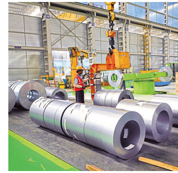
With demand from user industries recovering, steel buyers have been forced to absorb the higher cost.

The large steel mills of the country are expected to report decadal-high profits and a large increase in market share in the second half of the fiscal, given that repeated price hikes are doing little to dent domestic demand for the metal. Producers have hiked steel prices several times in the past 15 weeks, but with demand from user industries such as auto and construction recovering, buyers have been forced to absorb the higher cost.