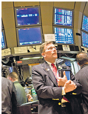
The NYSE made a U-turn after talking to regulators.

Political analysts expect little change in policy under