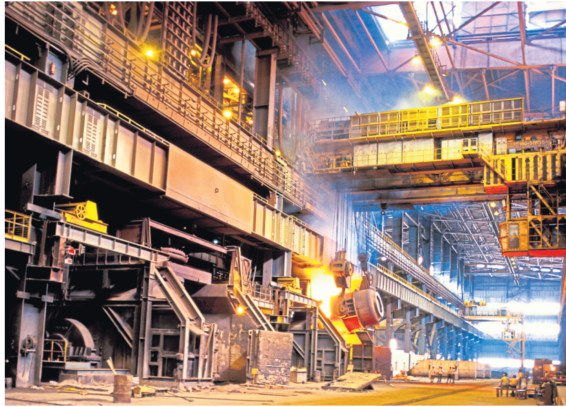
The sale proceeds from SAIL's Salem and Bhadravati steel plants will go directly to the state-run steelmaker as the two plants are its subsidiaries.

A planned strategic sale of two Steel Authority of India Ltd (SAIL) plants expected to be completed by 31 March will not add to the government's divestment receipts for this fiscal, a finance ministry official said on Tuesday, requesting anonymity. The sale proceeds will instead go directly to the state-run steelmaker as the two plants are its subsidiaries, the official said, adding that this is despite the Department of Investment and Public Asset Management (Dipam) handling the disinvestment process. The finance ministry is hopeful of completing the strategic sale of SAIL's Salem (Tamil Nadu) and Bhadravati (Karnataka) steel plants in this fiscal through March, the official said.