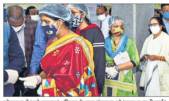
कोलकाता में 'द्वारे सरकार' अभियान के तहत मंगलवार को 'स्वास्थ्य साथी कार्ड' लेने के लिए कतार में खड़ी पश्चिम बंगाल की मुख्यमंत्री ममता बनर्जी।