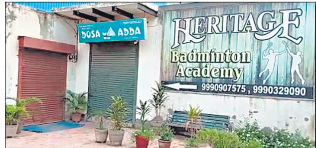
गुरुग्राम के सेक्टर-37 स्थित हैरिटेज बैडमिंटन अकादमी, जहां तीनों युवकों को पीटा गया।