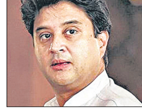
केन्द्रीय नागरिक उड्डयन मंत्री ज्योतिरादित्य सिधिया।

गौतमबुद्ध नगर के सांसद डॉ. महेश शर्मा ने कहा कि जेवर एयरपोर्ट पर पहले फेज में ही एमआरओ और कार्गो का काम भी प्रारम्भ हो जाएगा। सांसद भी पिछली केन्द्र सरकार में केन्द्रीय उड्डयन राज्य मंत्री रहे थे। उन्होंने विभाग से जुड़े अपने अनुभव भी केन्द्रीय मंत्री सिधिया से साझा की। इस मुलाकात के दौरान एयरपोर्ट को लेकर अभी तक हुए कार्यों को लेकर और वहां पर आने वाले अन्य प्रोजेक्टों को लेकर भी चर्चा