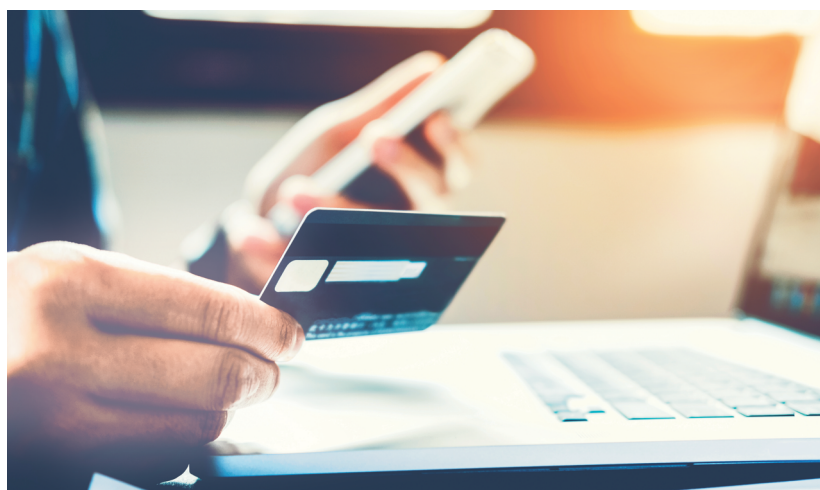
With greater mobilization, the demand for leisure goods and services increased as well and peaked before the second wave, a Cred analysis revealed.

In the first wave, spends on leisure in the national capital region stood at 13% of overall credit card spends. Leisure includes activities such as spending on food, including eating out at restaurants or ordering