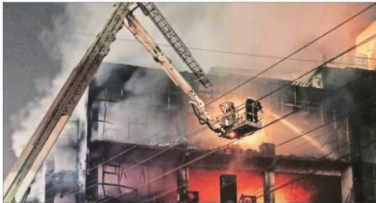
व्यावसायिक इमारत में लगी आग को फ़ेन के सहारे से बुझाते दमकल कर्मी।