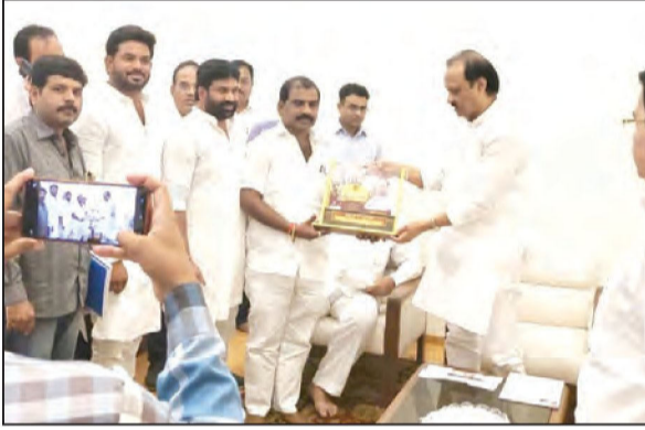
उपमुख्यमंत्री अजित पवार यांच्यासोबत सोलापूर शहराच्या विकासासाठी साकडे घातले.

सोलापूर शहरातील विकास कामे, राष्ट्रवादी पक्ष संघटना म