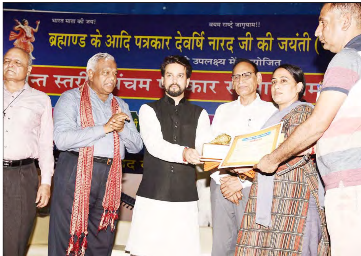
The Minister of State for Finance and Corporate Affairs, Anurag Singh Thakur presenting the awards of Vishwa Samvaad Kendra Nyas, at a function, at Gurugram University, Haryana.