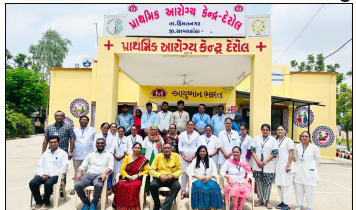
જીલ્લામાં પ્રથમ કક્ષાએ આવેલ છે જેમાં રાજ્ય આરોગ્ય અધિકારી તેમજ જિલ્લા તરફથી તમામ અધિકારીઓ હાજર રહ્યાં છે.

અમદાવાદ, હિંમતનગર તાલુકાના દરોલ પ્રાથમિક આરોગ્ય કેન્દ્ર ને ગુજરાતની દ્રષ્ટીએ રાષ્ટ્રીય કક્ષાનું પ્રમાણપત્ર આપવામાં આવ્યું હતું. કેન્દ્રની આરોગ્ય અને પરિવાર કલ્યાણ વિભાગ દ્વારા કરવામાં આવેલી જાહેરાત અંતર્ગત દરોલ પ્રાથમિક આરોગ્ય કેન્દ્ર ને નેશનલ ક્વોલિટી એસ્યોરન્સ આપવામાં આવ્યું છે. આરોગ્ય સેવાને લગતી રાષ્ટ્રીય કક્ષાની ગુણવત્તા સંબંધિત આ પ્રમાણપત્ર બાબતે અગાઉ જિલ્લાકક્ષાએથી રાજ્ય કક્ષાએ આરોગ્ય વિભાગ દ્વારા રજા માગેલી છે. આ અંતર્ગત વિવિધ માપદંડ પ્રમાણે દરોલ પ્રાથમિક આરોગ્ય કેન્દ્ર નું સર્વોચ્ચ સ્તુતિ કરવામાં આવ્યું હતું. નેશનલ ક્વોલિટી એસ્યોરન્સ પ્રમાણપત્ર આપવામાં આવ્યું છે. આ અંતર્ગત વિવિધ માપદંડ પ્રમાણે દરોલ પ્રાથમિક આરોગ્ય કેન્દ્ર નું સર્વોચ્ચ સ્તુતિ કરવામાં આવ્યું હતું. નેશનલ ક્વોલિટી એસ્યોરન્સ પ્રમાણપત્ર આપવામાં આવ્યું છે. આ અંતર્ગત વિવિધ માપદંડ પ્રમાણે દરોલ પ્રાથમિક આરોગ્ય કેન્દ્ર નું સર્વોચ્ચ સ્તુતિ કરવામાં આવ્યું હતું. નેશનલ ક્વોલિટી એસ્યોરન્સ પ્રમાણપત્ર આપવામાં આવ્યું છે.