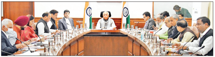
चंडीगढ़। सिविल सचिवालय में कैबिनेट मीटिंग की अध्यक्षता करते हुए मुख्यमंत्री मनोहर लाल।