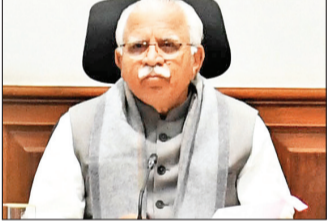
हरिभूमि ब्यूरो ►► चंडीगढ़

लेन-देन जिसमें खरीदी या बेची गई कृषि की डिलीवरी वास्तव में नहीं की जाती है और डीलर पर केवल उस लेनदेन के संबंध में शुल्क लगाया जाएगा जिसमें कोई शुल्क नहीं लगाया जाएगा। कोई भी को 2500 रुपये प्रति किंवांत तक की कीमत पर बेचा जाता है तो 50 रुपये यदि एक मुश्त आधार पर 2500 रुपये प्रति किंवांत से अधिक की कीमत पर बेचा जाता है। यदि धान