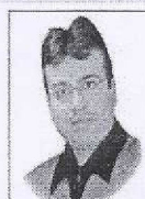
निफत मस्ट रिपोर्ट कर्मांडर, डेप्युटी चैरमैन