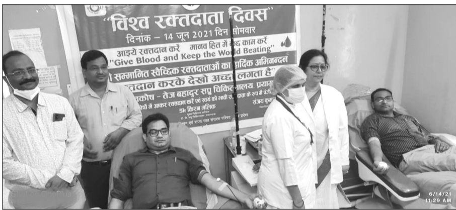
बेली अस्पताल में रक्तदान करते चिकित्सक।

पिछले तीन दिनों से कहीं रिमझिम तो कहीं झमाझम बारिस हो रही है। इसकी वजह से मौसम सुहाना है। सोमवार को कुछ ऐसा ही हुआ। दोपहर बाद बारिश की बूंदें बंद हुई लेकिन बादल छाये रहे। धूप न होने की वजह से लोग संगम की ओर रुख कर लिये। जहां सैकड़ों लोग संगम के किनारे घूमते नजर आये। उनमें से काफी लोग बिना मास्क के ही घूम रहे थे और सोशल डिस्टेंसिंग धड़ाम थी। युवक-युवतियां एवं परिवार के साथ गये लोग सेल्फी लेने में भी जुटे रहे।