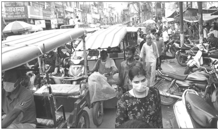
चौक में लगा जाम।

कोरोना संक्रमण कम हुआ है खतरा नहीं हुआ है छोटी सी लापरवाही फिर से घातक हो सकती है। लोगों को पुलिस के जवान लगातार जागरूक कर रहे हैं मास्क लगाकर बाहर निकलने एवं सोशल डिस्टेंसिंग के पास के लिये जागरूक किया जा रहा है फिर भी लोग लापरवाही कर रहे हैं। पुलिसकर्मियों को निर्देश दिया गया है कि कोविड की गाइड लाइन का मुसंदी से पालन कराया जाये एवं लापरवाह करने वालों पर कार्रवाई की जाय।