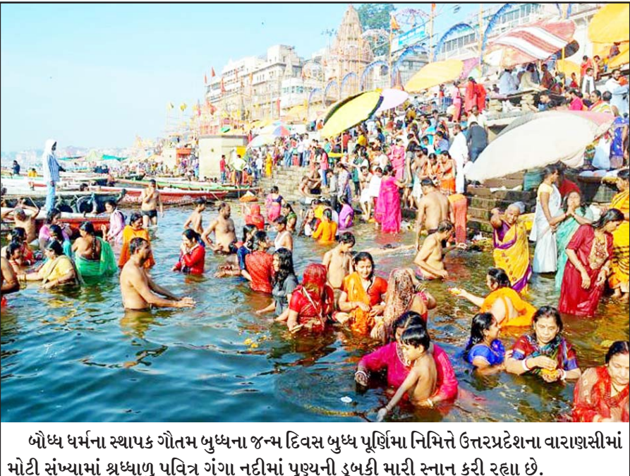
બૌદ્ધ ધર્મના સ્થાપક ગૌતમ બુદ્ધના જન્મ દિવસ બુદ્ધ પૂર્ણિમા નિમિત્તે ઉત્તરપ્રદેશના વારાણસીમાં મોટી સંખ્યામાં શ્રદ્ધાળુ પવિત્ર ગંગા નદીમાં પૂજ્યની ડૂબકી મારી સ્નાન કરી રહ્યા છે.