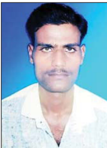
मृतक की फाइल फोटो।

शुक्लागंज (एसएनबी)। गंगाघाट कोतवाली क्षेत्र के पिपरी ग्राम सभा के रामबखश खेड़ा में मांके के घर पर रहने वाला एक युवक का शव मंगलवार को एक पेड़ पर लटका पाया गया। जानकारी पर ग्रामीणों की भीड़ मौके पर लग गई। सूचना पर पहुंची पुलिस ने जांच पड़ताल के बाद शव को पोस्टमार्टम के लिए भेजा।