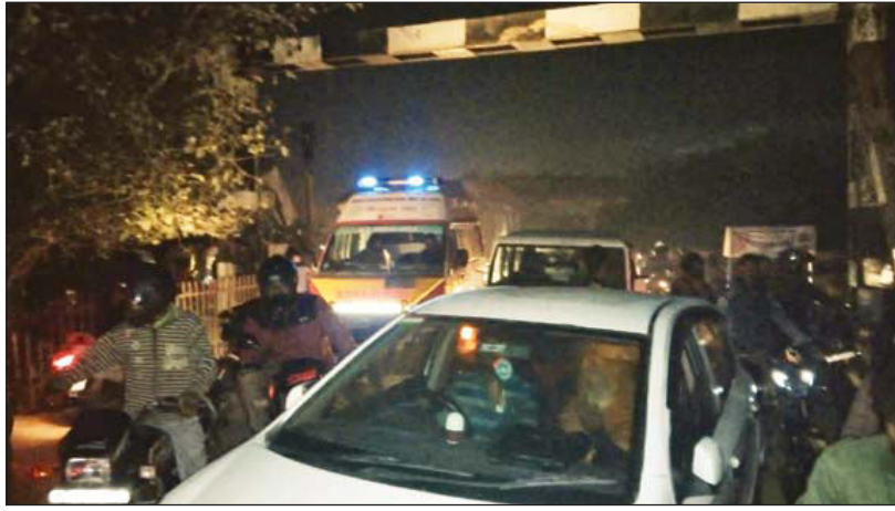
शुक्लागंज : देर शाम सरैयां क्रॉसिंग पर लगे भीषण जाम में फंसे वाहन सवार।