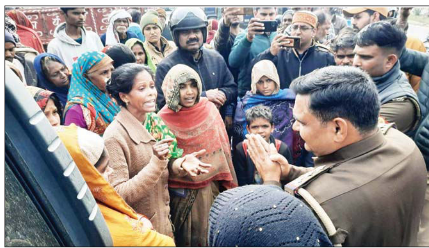
शुक्लागंज : पुलिस के अधिकारी से बहस करती महिला।