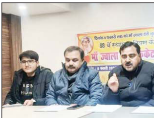
कैशमनी क्रिकेट प्रतियोगिता की जानकारी देते आयोजक।

शुक्लागंज। शुक्लागंज के 88वें स्थापना दिवस के अवसर पर नगर के रामकली स्टेडियम में 19वीं मां ज्वालादेवी क्रिकेट ट्राफी (पचास हजार कैशमनी) का शुभारम्भ धूमधाम से किया जायेगा।